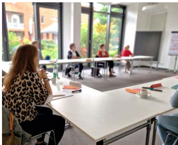
Die Arbeitskreise treffen sich beim Paritätischen.

In den Arbeitskreistreffen sprechen die Teilnehmenden über die konkrete Arbeit und entwickeln Ideen, woran man gemeinsam arbeiten will. Die Arbeitskreise pflegen auch den offenen Austausch mit externen Referent*innen,